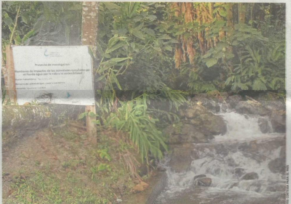
El fondo de agua por la vida y la Sostenibilidad se creó hace 8 años a través de una alianza entre empresas privadas y organizaciones sin ánimo de lucro con el fin de mejorar la calidad de 26 caudales del río Cauca en todo el departamento.

El vocero de Nature Conservancy afirmó que "el Fondo de Agua por la