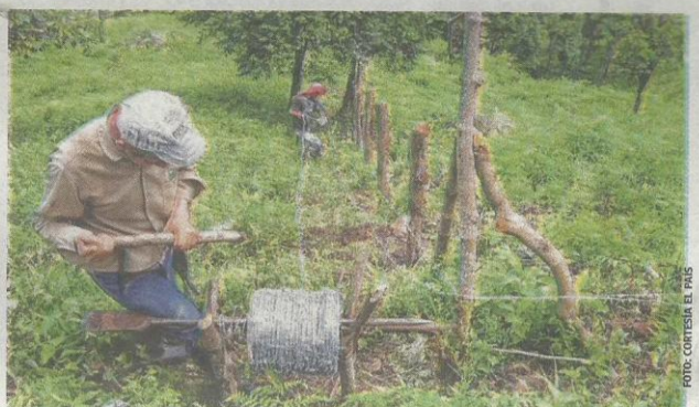
El gremio de campesinos y agricultores del Valle del Cauca realiza actividades alternas con el fin de mantener preservados los ecosistemas de la región.